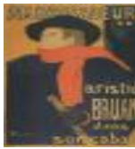
絵画名 アンバサドルのアリスティード・ブリュアン 作者名 アンリ・ド・トゥールーズ=ロートレック 備考