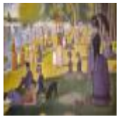
絵画名 グランド・ジャット島の日曜日の午後 作者名 ジョルジュ・スーラ 備考