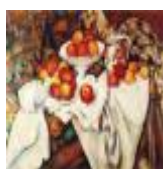
絵画名 りんごとオレンジ 作者名 ポール・セザンヌ 備考