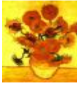
絵画名 ひまわり 作者名 フィンセント・ファン・ゴッホ 備考