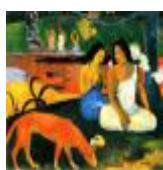
絵画名 アレアレア 作者名 ポール・ゴーギャン 備考