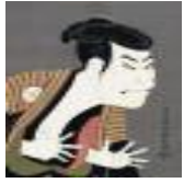
絵画名 三代目大谷鬼次の奴江戸兵衛 作者名 東洲斎 写楽 備考