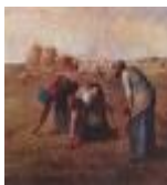
絵画名 落穂拾い 作者名 ジャン=フランソワ・ミレー 備考 タヌキ商店 の 目玉商品