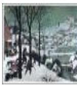
絵画名 雪中の狩人 作者名 ピーテル・ブリューゲル 備考