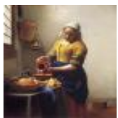
絵画名 牛乳を注ぐ女 作者名 ヨハネス・フェルメール 備考