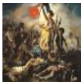
絵画名 民衆を導く自由の女神 作者名 ウジェーヌ・ドラクロワ 備考