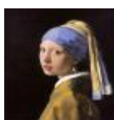
絵画名 真珠の耳飾りの少女 作者名 ヨハネス・フェルメール 備考