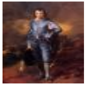
絵画名 青衣の少年 作者名 トマス・ゲインズバラ 備考 タヌキ商店 の 目玉商品