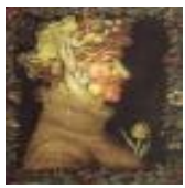
絵画名 四季<夏> 作者名 ジュゼッペ・アルチンボルド 備考