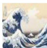
絵画名 富嶽三十六景 神奈川沖浪裏 作者名 葛飾 北斎 備考