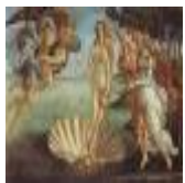
絵画名 ヴィーナスの誕生 作者名 サンドロ・ボッティチェッリ 備考