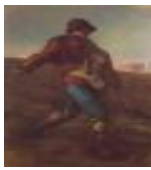
絵画名 種まく人 作者名 ジャン=フランソワ・ミレー 備考