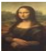
絵画名 モナ・リザ 作者名 レオナルド・ダ・ヴィンチ 備考