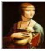
絵画名 白貂を抱く貴婦人 作者名 レオナルド・ダ・ヴィンチ 備考