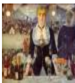
絵画名 フォリ=ベルジェールの酒場 作者名 エドゥアール・マネ 備考